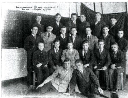
Состав коллектива ПТФ в годы войны. 1. 1941 г.